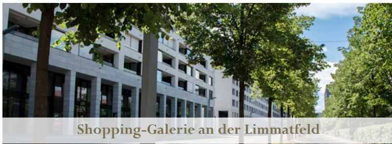
Shopping-Galerie an der Limmatfeld